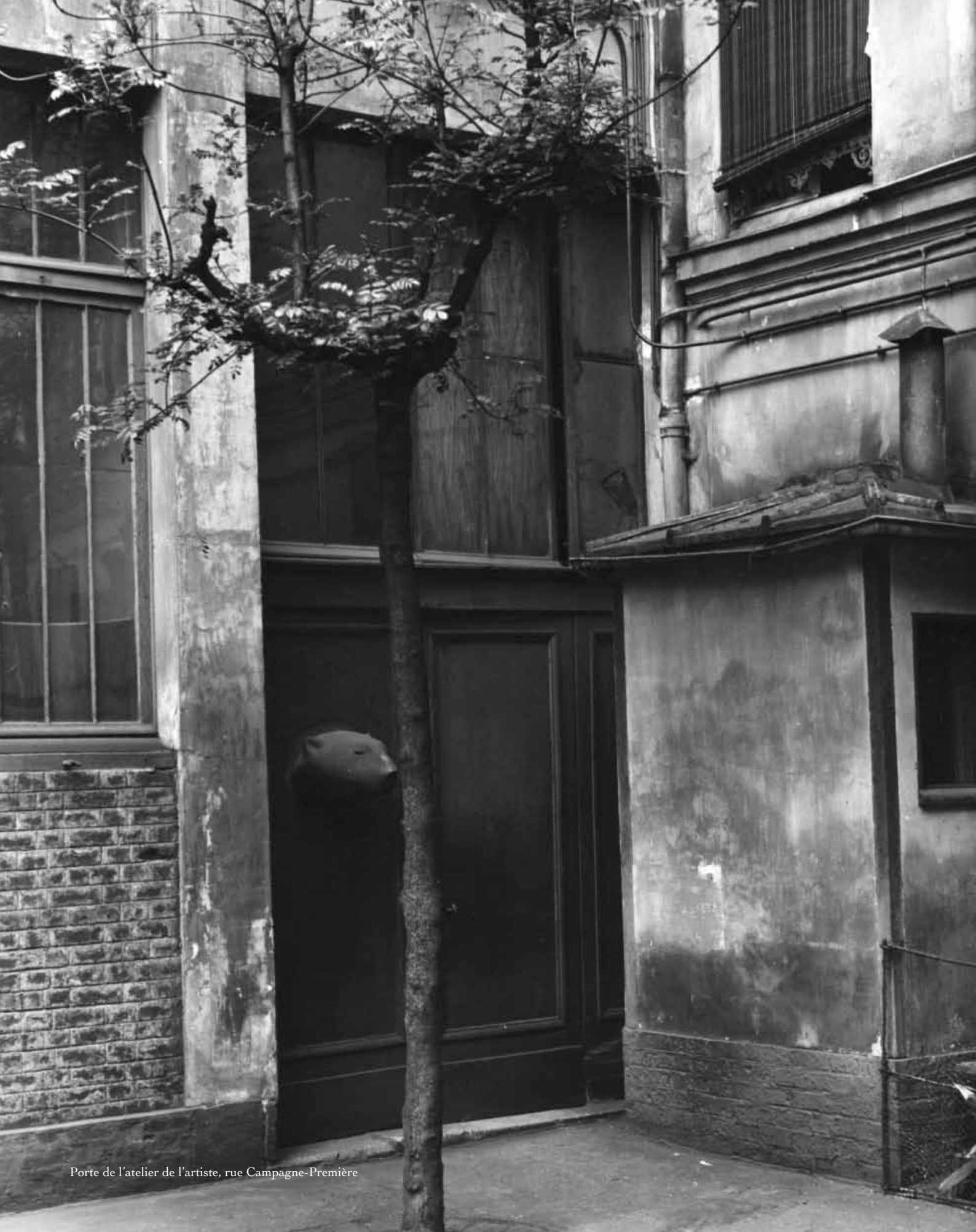
Porte de l'atelier de l'artiste, rue Campagne-Première