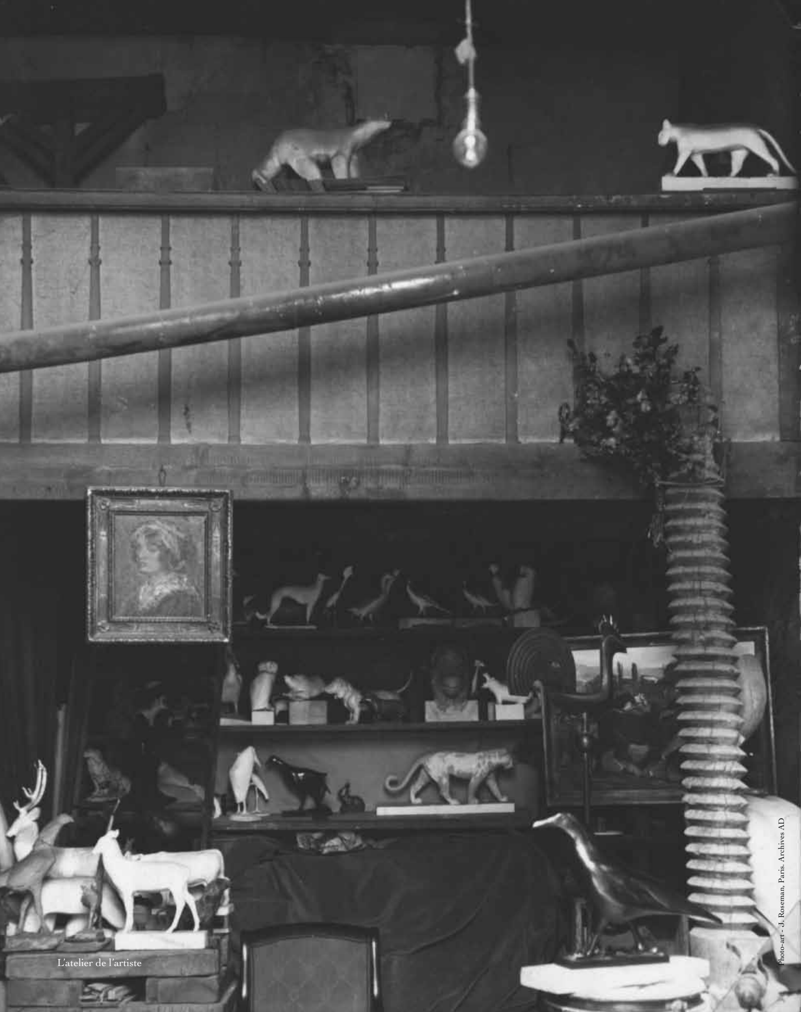
L'atelier de l'artiste