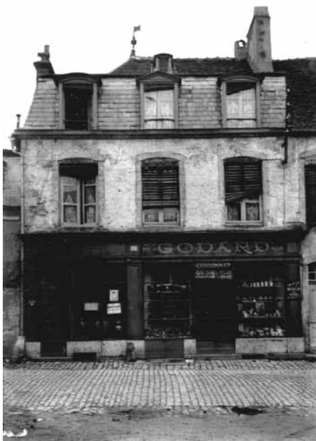
Maison natale de Pompon à Saulieu

Pour Pompon un volume se définit dans l'espace par la pureté de la ligne et chaque sculpture peut se lire en ombre chinoise. Plus la sculpture se débarrasse des détails du modelé naturaliste, plus la forme apparaît dans son essence. Mais cela suppose une parfaite connaissance de l'anatomie de l'animal. Par exemple, si on passe la main sur le dos de « l'Ours blanc », la pièce qui l'a rendu célèbre (elle entre au Musée du Luxembourg en 1927), on peut sentir le sque-