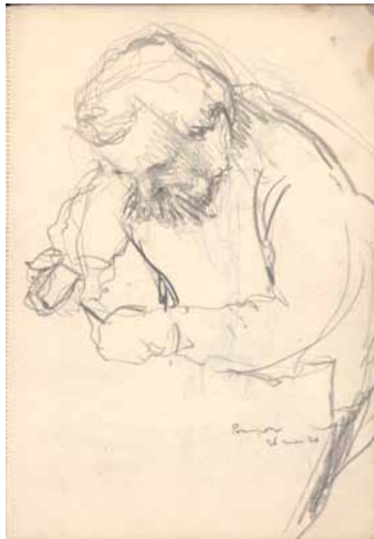
Pompon par René Demeurisse, 26 mars 1920

la vie de l'œuvre de Pompon après sa disparition et vécu son engagement comme un véritable devoir de mémoire envers son ami sculpteur disparu.