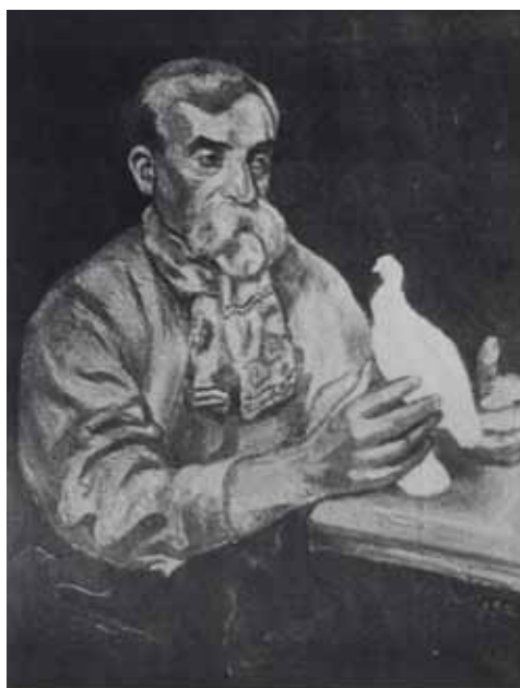
René Demeurisse, Le sculpteur François Pompon , Huile sur toile, Musée d'Art Moderne de la Ville de Paris.

[La même année] mon mari organise au Salon d'Automne la grande Rétrospective des œuvres de Pompon préfacée par Robert Rey. Il écrit aussi l'article